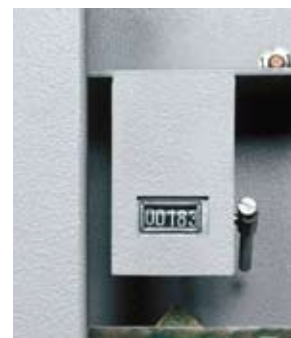
Le compteur et le scellé du foncet (en option): de précieux indices pour savoir si l'armoire a été ouverte en votre absence.