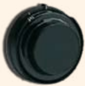
Serrure à combinaisons