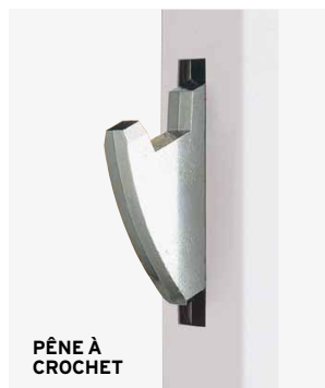
PÈNE À CROCHET